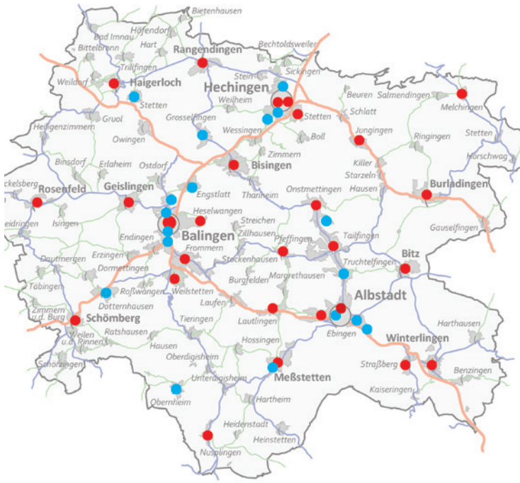
Rote Punkte = Geschäftsstellen beziehungsweise Finanz-Center, blaue Punkte = SB-Stellen

Wer in Zukunft auf Finanzdienstleistungen vor Ort zugreifen möchte, muss sich hierzu gut rüsten. Laut einer aktuellen Untersuchung der Bundesbank schließen in Deutschland immer mehr Bankfilialen. Oft stecken dahinter Kostendruck und Digitalisierung. So sank die Zahl der Zweigstellen deutscher Kreditinstitute im vergangenen Jahr um fast 6 Prozent auf aktuell etwas mehr als 20.400 Bankfilialen. Damit hat sich die Zahl der Standorte binnen zehn Jahren fast halbiert. Der Rückgang bei den Großbanken lag im vergangenen Jahr bei fast 8 Prozent. Sollten auch Sie von diesem Trend in der Region Zollernalb betroffen